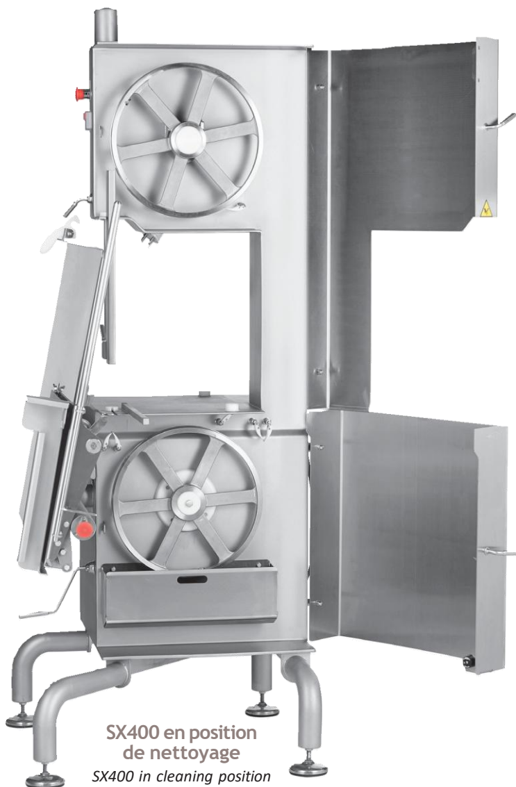
SX400 en position de nettoyage SX400 in cleaning position