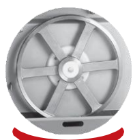
Poulie inférieure Lower wheels

Entirely stainless steel 18-10. Frame strong thickness perfectly rigid. Automatic blade stretcher. Sliding upper blade guide keeping in automatic position. Moving carriage for SX400. Very easy to maintain. Motor and electrical components protected against water splash. Complies CE norms. Certified Adiva.