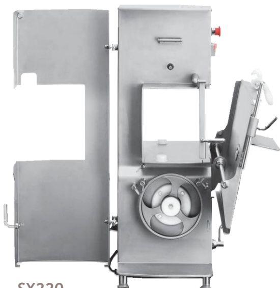
SX220 Position nettoyage - Plateau basculant Cleaning position - Tip table