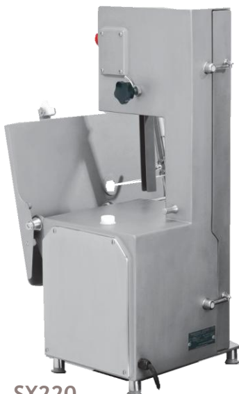
SX220 Porte arrière étanche avec joint silicone Silicone water tight joint on back door